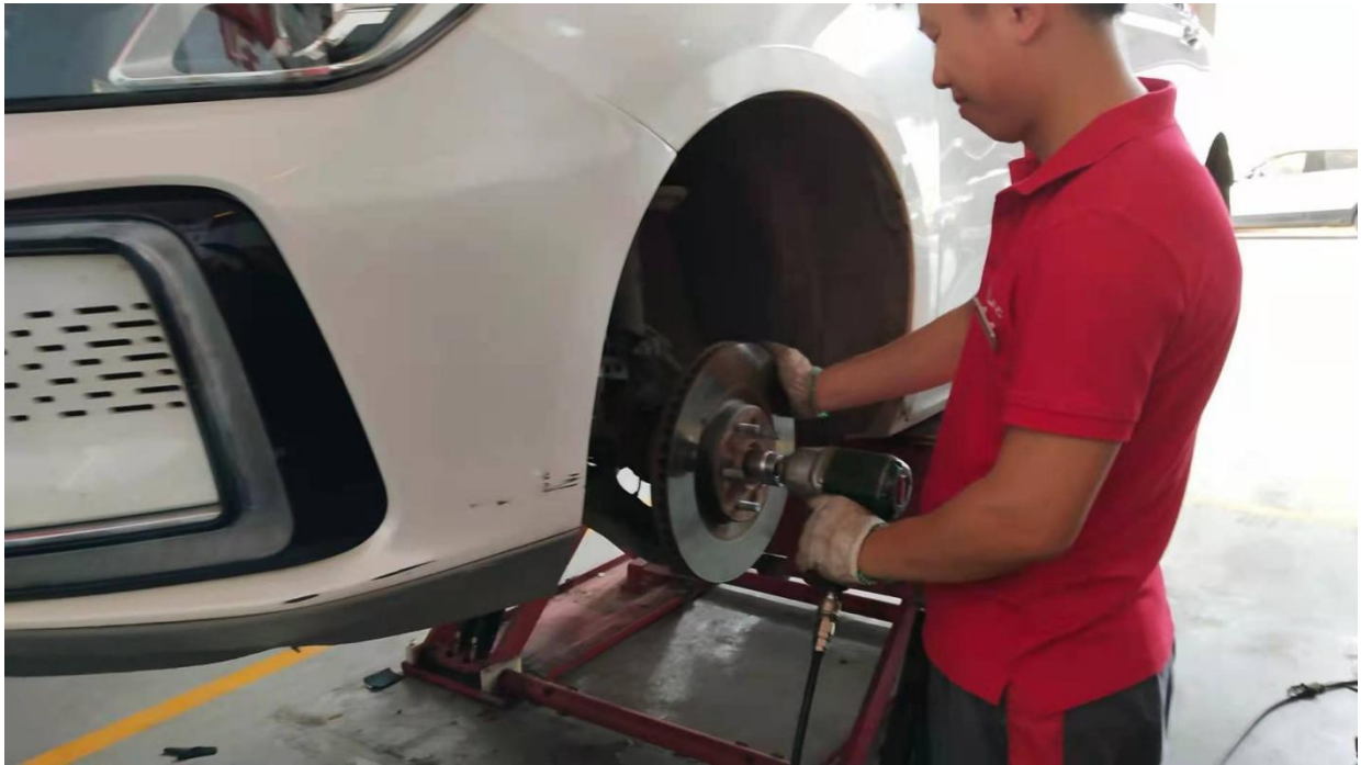
学生在实训基地实习汽车维修操作