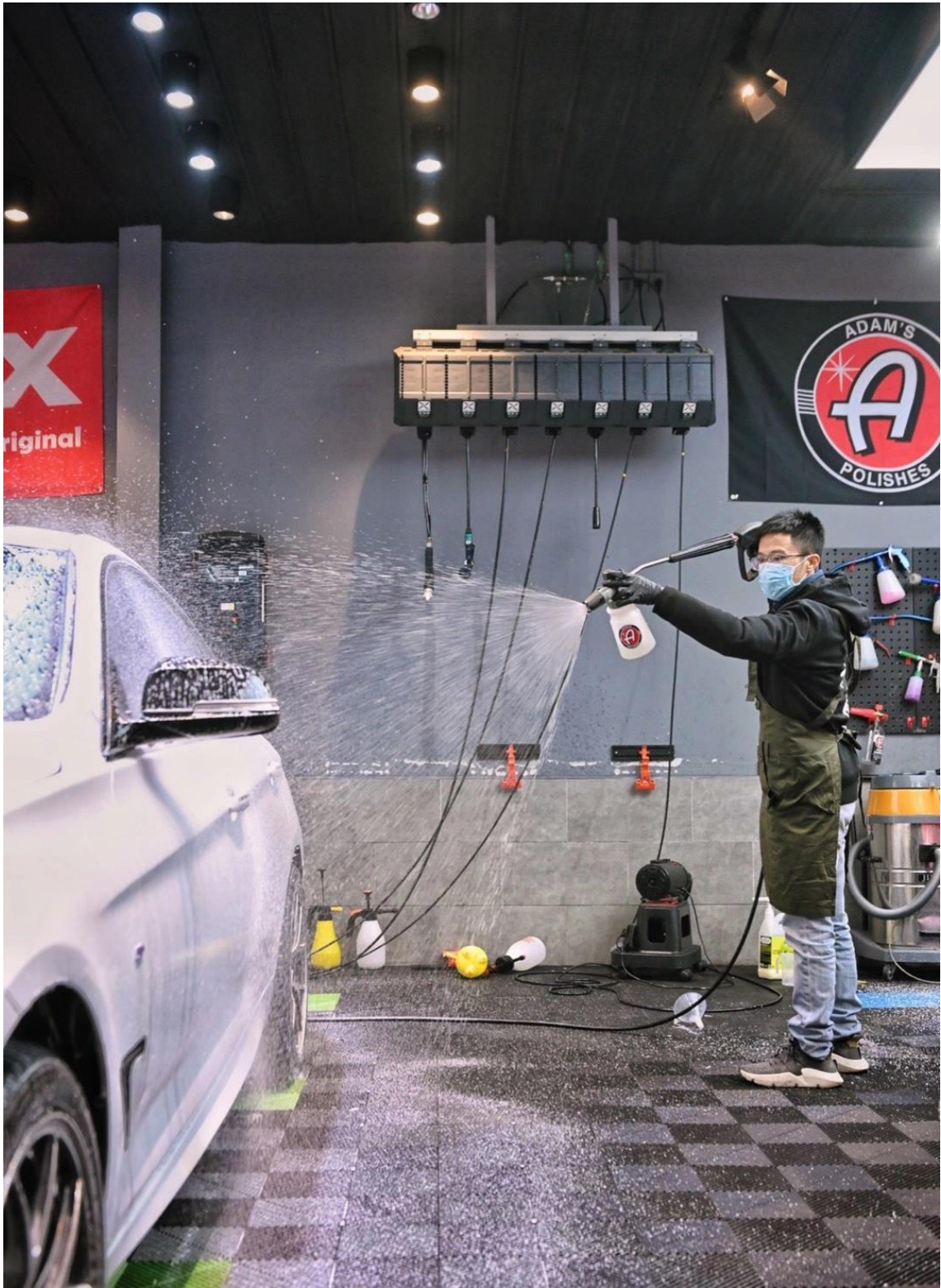
学生在实训基地实习汽车美容操作