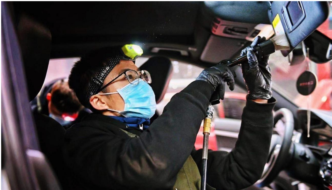
学生在实训基地实习汽车美容操作