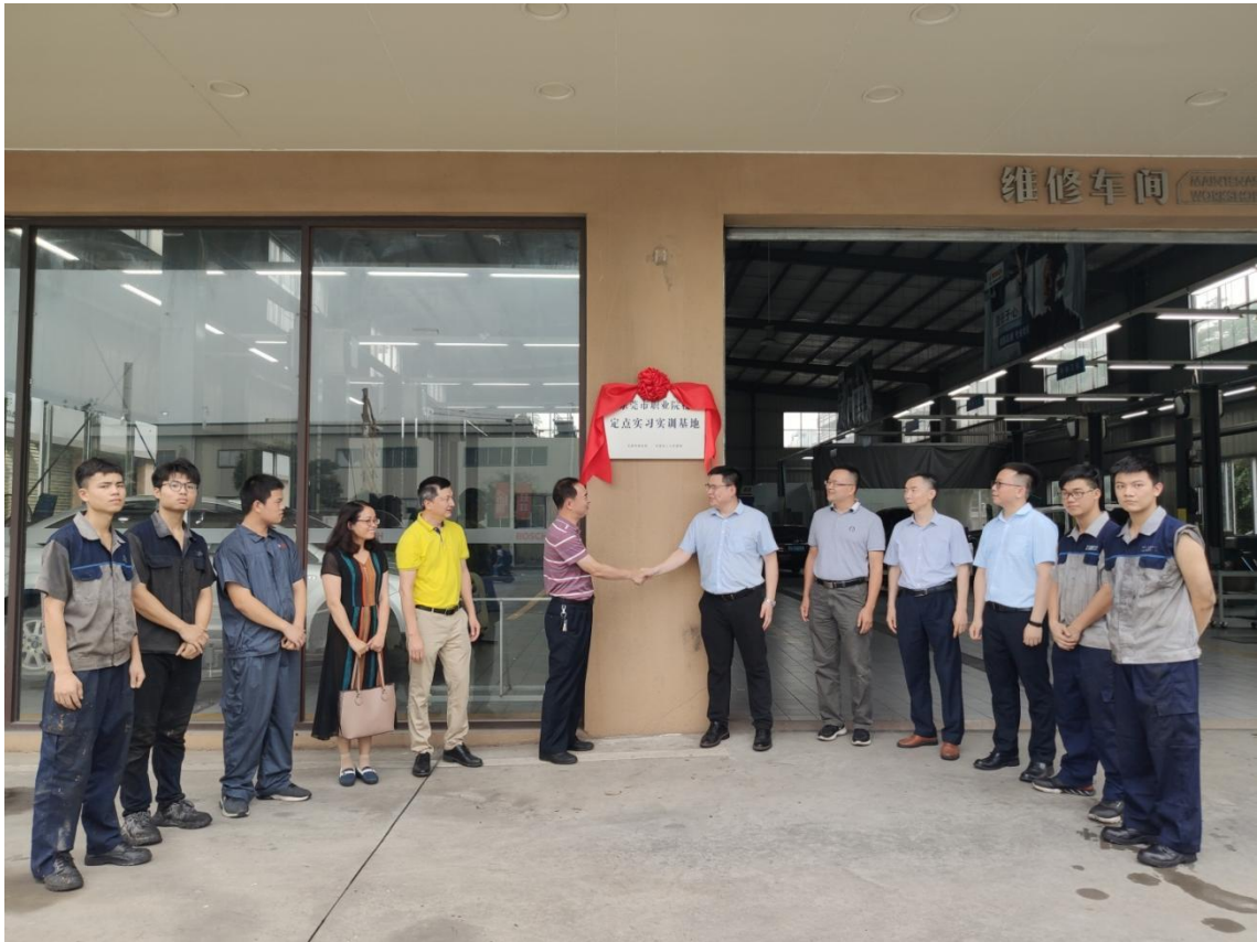
尚盛汽车服务公司实训基地挂牌仪式