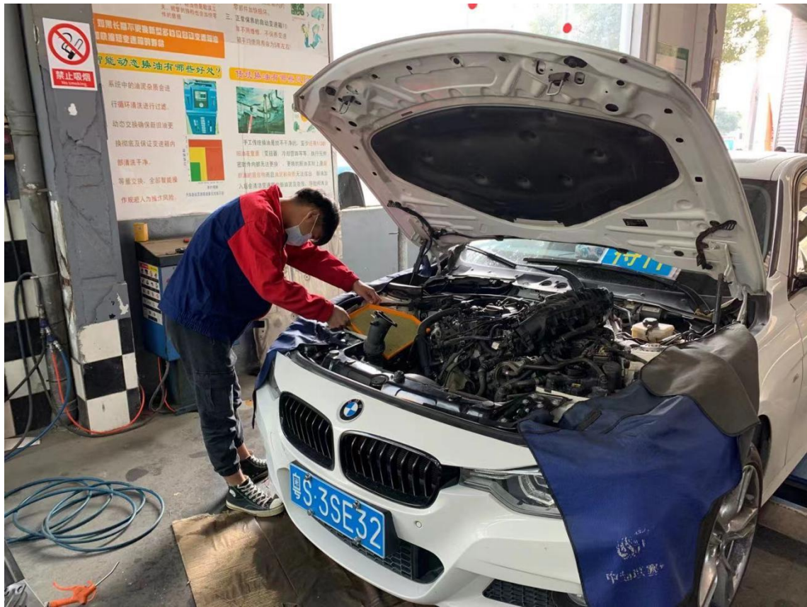
学生在实训基地实习汽车保养操作