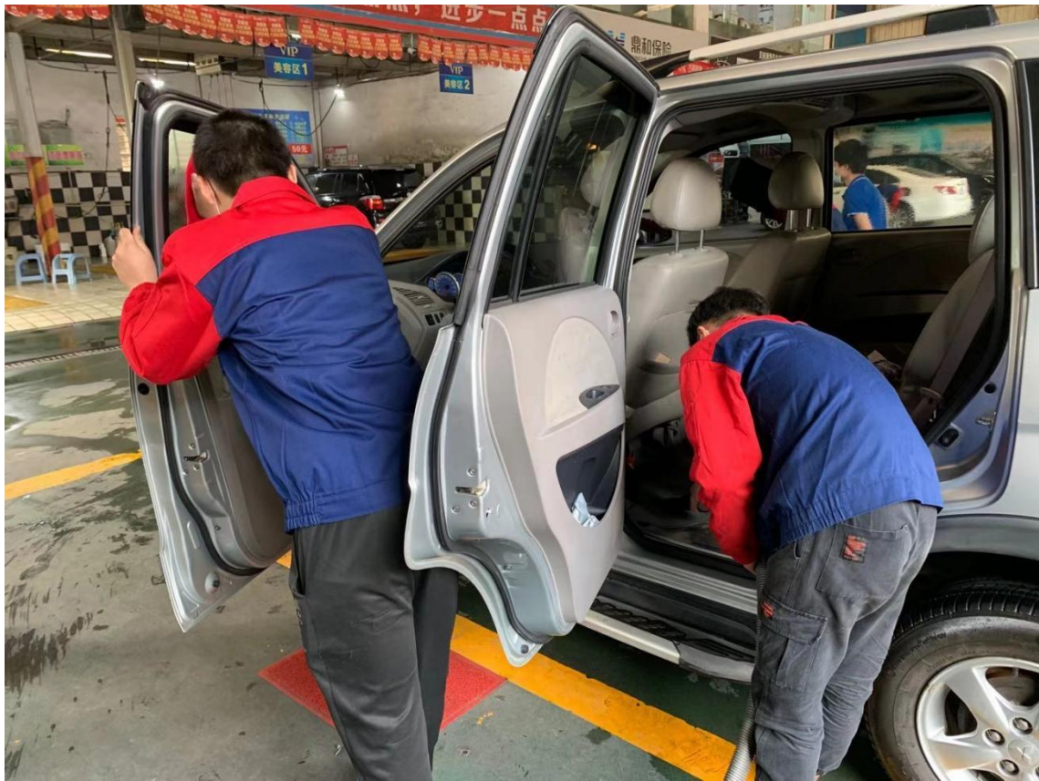
学生在实训基地实习汽车美容操作