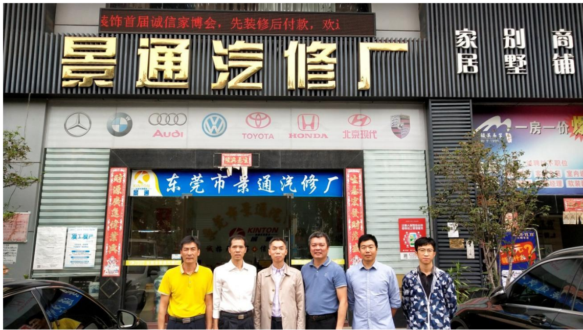
学校领导参观景通汽修厂实训基地