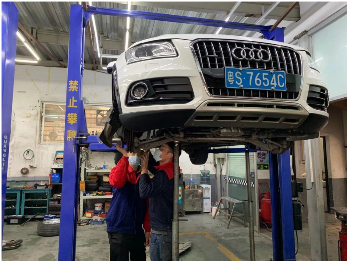
学生在实训基地实习汽车维修操作