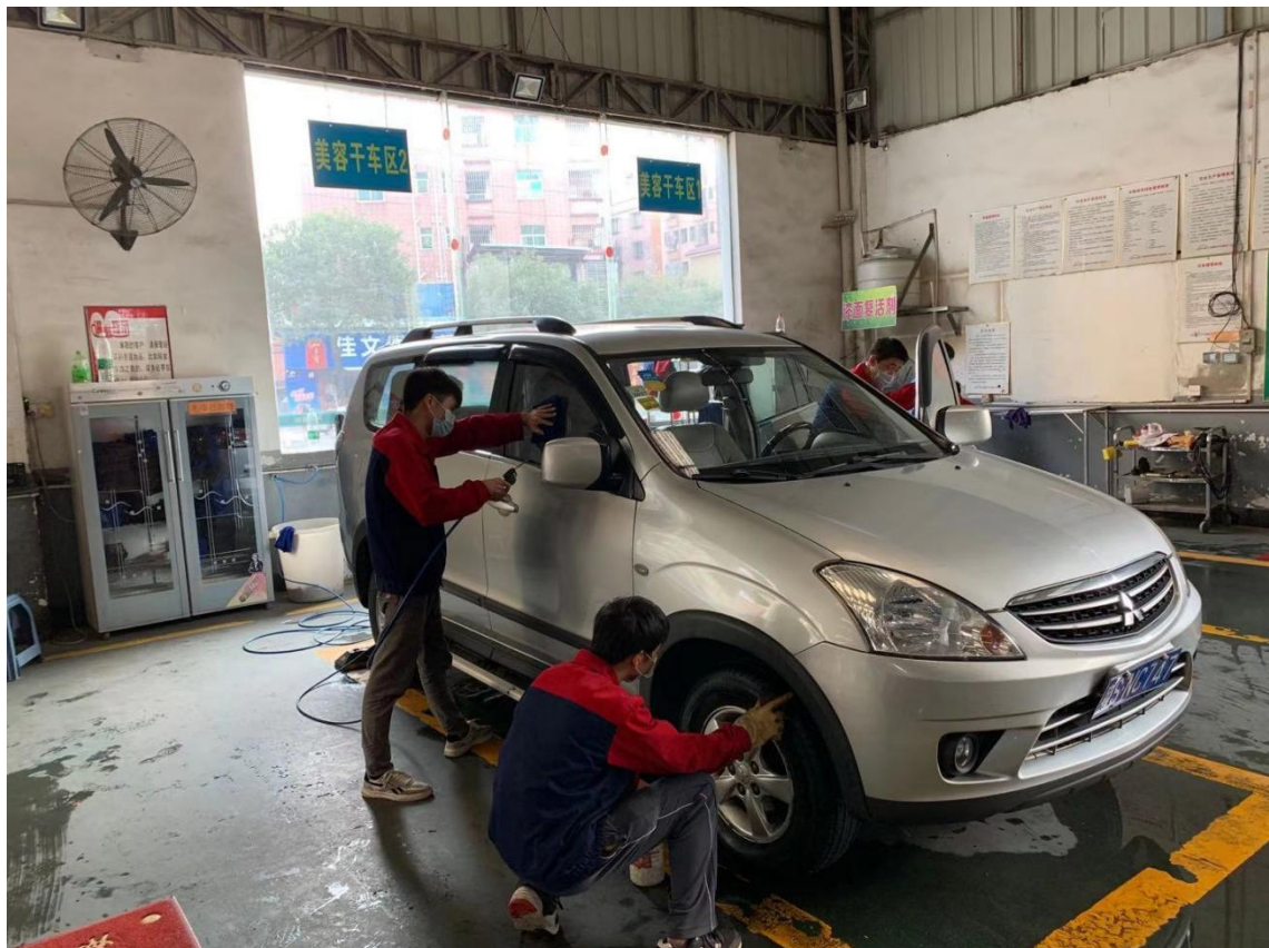
学生在实训基地实习汽车美容操作