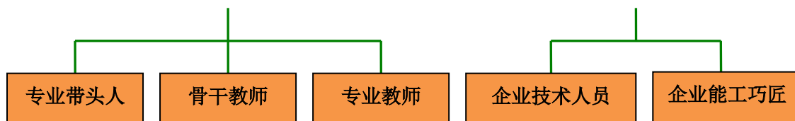
图1 汽车运用与维修专业师资队伍构成

本专业教学团队人数按师生比 1: 25 配置，专兼职教师比例一般为 4:1，专兼职教师任专业课学时比例一般不超过 6:1。